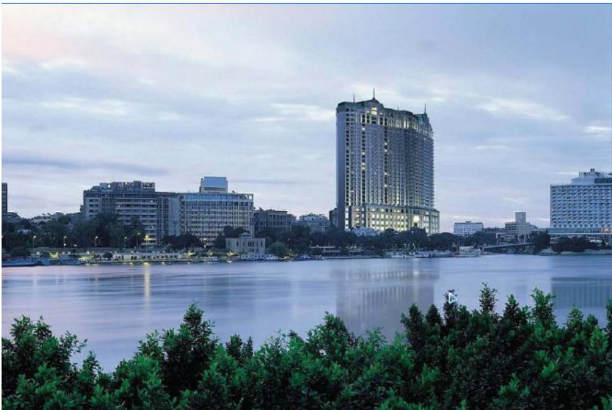
标志性建筑——开罗四季酒店

【首都】埃及首都开罗位于尼罗河三角洲顶点以南14公里处，北距地中海200公里，是埃及的政治、经济、商业和文化中心。开罗省、吉萨省、盖勒尤比省共同组成的大开罗区，人口超过2500万，是阿拉伯和非洲国家人口最多的城市，是世界第十六大都会区。古埃及人称开罗为“城市之母”，阿拉伯人把开罗称作“卡海勒”，意为征服者或胜利者。