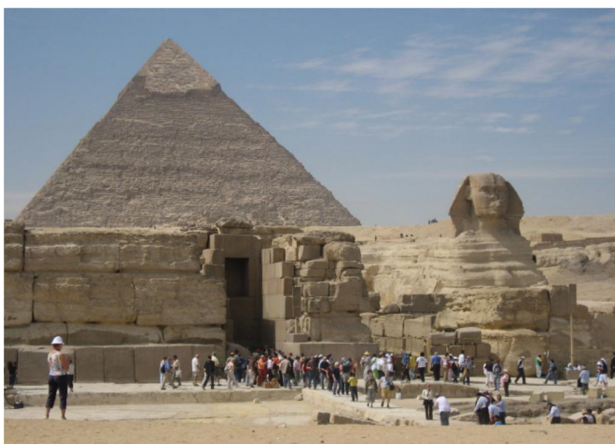
金字塔和狮身人面像

【发展简史】埃及是世界四大文明古国之一。公元前3200年，美尼斯统一埃及，建立第一个奴隶制国家。此后经历早王国、古王国、中王国、新王国和后王朝时期，共30个王朝。古王国开始大规模兴建金字塔。中王国经济发展、文艺复兴。新王国生产力显著提高，开始对外扩张，成为军事帝国。后王朝时期，内乱频繁，外患不断，国力日衰。公元前525年，埃及成为波斯帝国的一个行省。在此后的一千多年间，埃及相继被希腊和罗马征服。公元641年，阿拉伯人入侵，埃及逐渐阿拉伯化，成为伊斯兰教的一个重要中心。1517年被土耳其人征服，成为奥斯曼帝国的行省。1882年被英军占领后，成为英国“保护国”。